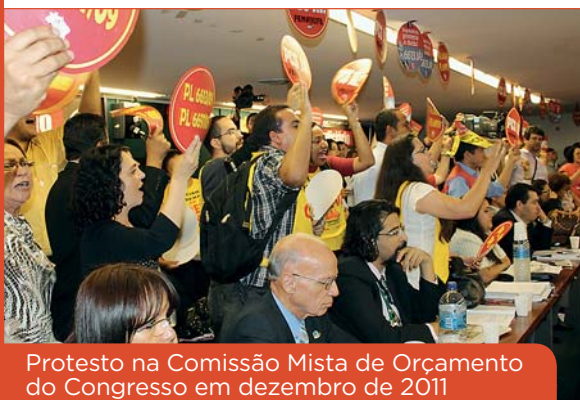
Protesto na Comissão Mista de Orçamento do Congresso em dezembro de 2011

A partir de uma negociação com o Executivo, o STF encaminhou ao Congresso o PL 4363/12, que reajusta a Gratificação Judiciária (GAJ) de 50% para 100%. O mesmo foi feito pela Procuradoria-Geral da República, ao enviar o PL 4362/12, que reajusta a Gratificação de Atividade no MPU (Gampu) também de 50% para 100%. Até o fechamento desta edição, os projetos ainda não haviam sido aprovados no Congresso, mas a categoria segue mobilizada para garantir o reajuste salarial.