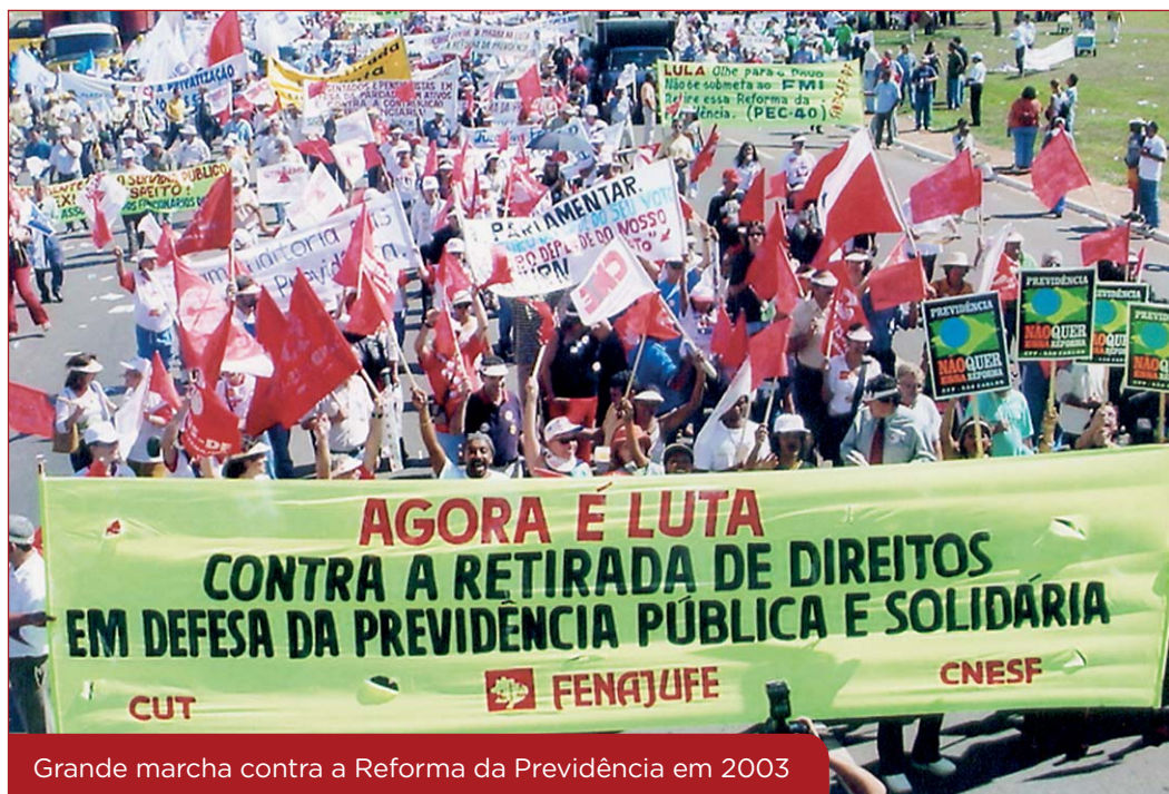
Grande marcha contra a Reforma da Previdência em 2003

Os servidores se mantiveram unidos e continuaram na luta em defesa de seus direitos e pela abertura do debate público sobre a proposta de reforma da Previdência. O governo, no entanto, foi intransigente e, mesmo após a suspensão do movimento grevista, em muitos estados foi mantido o estado de greve e realizadas diversas manifestações.