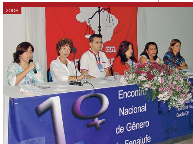
1º Encontro Nacional de Gênero da Fenajufe