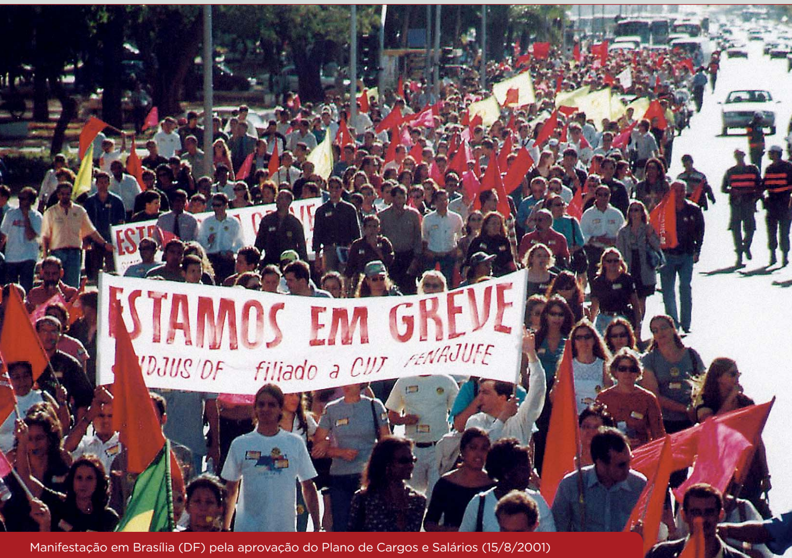
Manifestação em Brasília (DF) pela aprovação do Plano de Cargos e Salários (15/8/2001)