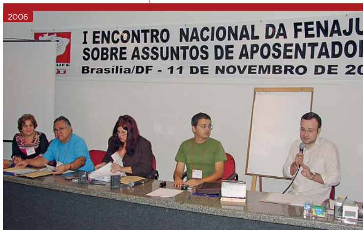
I Encontro Nacional da Fenajufe sobre Assuntos de Aposentadoria