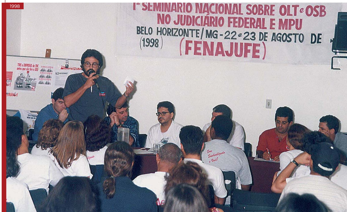
1º Seminário Nacional sobre Organização no Local de Trabalho no Judiciário Federal e MPU Promovido pela Fenajufe, em Belo Horizonte (MG), nos dias 22 e 23 de agosto de 1998.